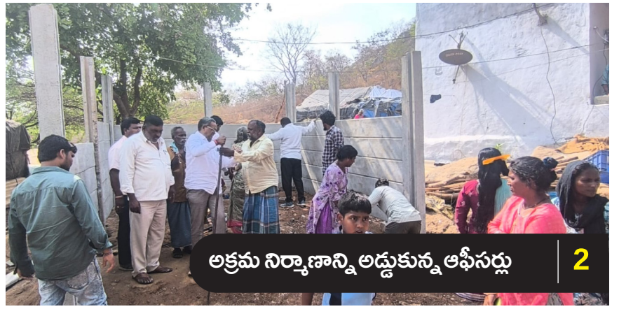
అక్రమ నిర్మాణాన్ని అడ్డుకున్న ఆఫీసర్లు

సంపుటి : 01 | సంచిక : 180 | వరంగల్ | ఆదివారం, 05 ఏప్రిల్ 2026 | పేజీలు : 02