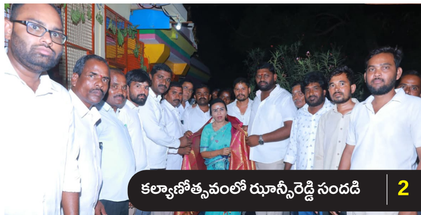
కల్యాణోత్సవంలో రూన్సీరెడ్డి సందడి