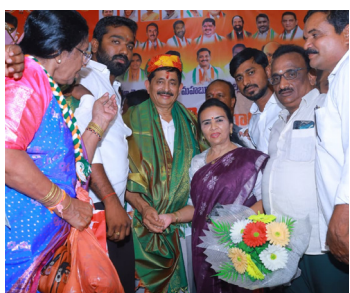
నాయకులు, కార్యకర్తలు మరియు అభిమానులు పెద్ద సంఖ్యలో పాల్గొన్నారు.