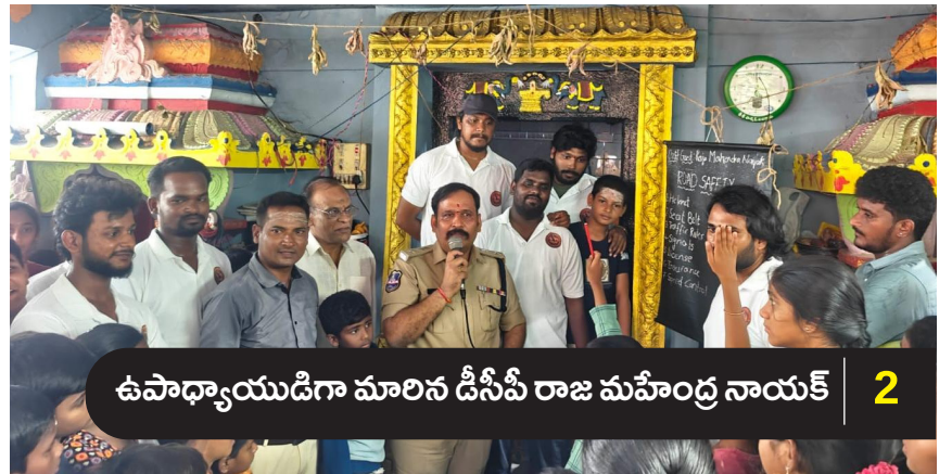
ఉపాధ్యాయుడిగా మారిన డీసీపీ రాజ మహేంద్ర నాయక్ 2

సంపుటి : 01 | సంచిక : 234 | వరంగల్ | శనివారం, 13 జూన్ 2026 | పేజీలు : 02